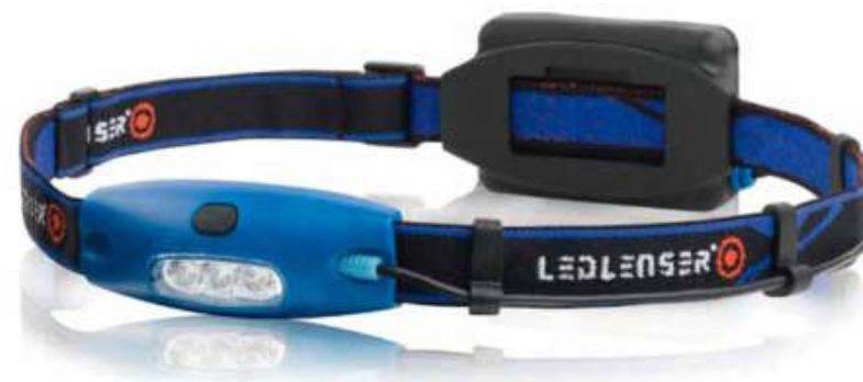
LED LENSER® H4