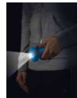
Lampe de poche